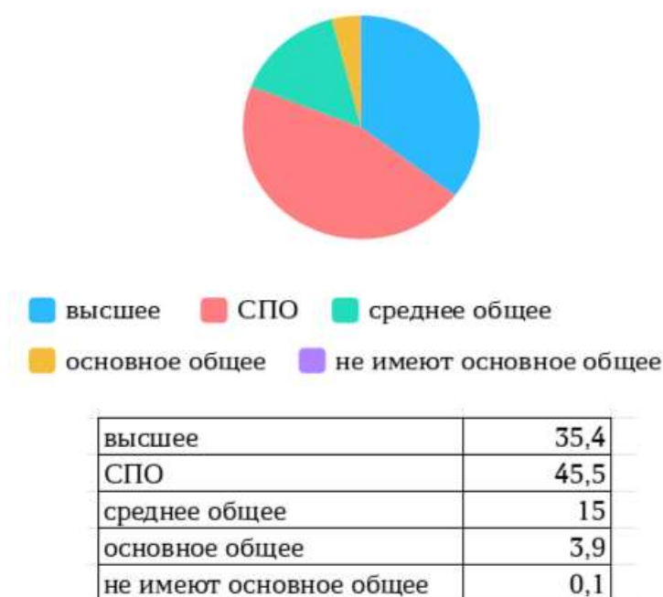
Рис. 2 - Структура занятых по уровню образования, %

По данным статотчетности максимально удельный вес занятых находится в диапазоне 25-59 лет, далее наблюдается снижение. При этом, у мужчин данный показатель достигает отметки 64 года, у женщин - 59 лет. Максимальный удельный вес из числа занятых - 15,6% в диапазоне 35-39 лет как у мужчин, так и у женщин. В структуре занятых по уровню образования преобладают специалисты со средним профессиональным образованием – 45,5% (рис. 2).